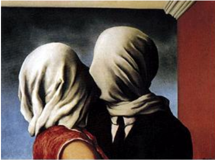
"Gli amanti" di René Magritte - 1928

Per descrivere l' infedeltà "ricerca" , dovremmo affermare che è in linea rispetto al comportamento tipico maschile di 1) cercare soluzioni, 2) andare a cercare risorse (per la soluzione dei problemi) fuori dei confini familiari, 3) di portare nel nucleo familiare, le esigenze della sensualità e l'approccio estetico, estatico e orgiastico.